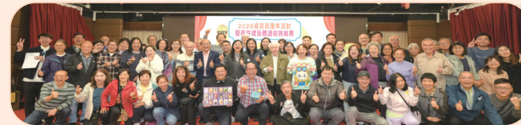
• 導賞員嘉許禮：向一眾無私付出的導賞員，致以衷心感謝。