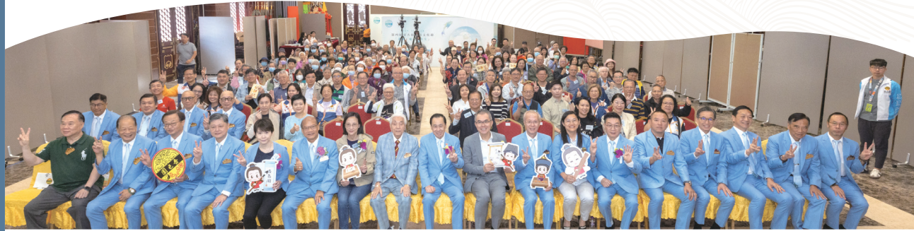
● 開幕典禮已於2025年11月15日圓滿舉行。

「迎齋色園105周年紀慶：第四屆黃大仙信俗文化節」已於2025年11月15日至11月23日圓滿舉行。本屆文化節以「萬物·和諧·共生」為主題，透過逾20項活動，回應社會對生態保育與可持續發展的關注，展現傳統文化與當代議題的深度連結。