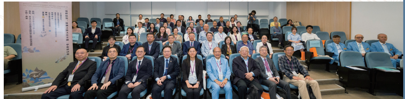
• 「道釋相激：絲綢之路沿線文化交融」學術研討會於4月21日起一連三日，在香港中文大學康本國際學術園舉行，逾四十名學者發表研究成果。