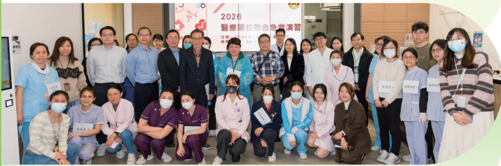
● 嗇色園轄下醫療單位2026年2月4日舉行聯合急救演習，提升員工急救知識及實際操作技能。

演習於當天中午12時正展開，主題為「心肺復甦法及自動心臟除顫器(CPR/AED)」，個案設定為「45歲女士在近牙科走廊的大堂暈倒，不省人事」。在西醫團隊的帶領下，來自牙科及物理治療的同事迅速投入角色，各司其職，順暢完成一系列的緊急救護程序，展現出良好的團隊默契。