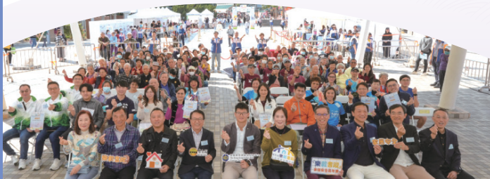
● 嗇色園舉行「樂載耆蹤家居安全嘉年華」，向公眾推廣居家安老的重要性。

嘉年華以受助長者為主題的感人短片揭開序幕，介紹計劃的服務成效。場內亦設有多個互動攤位遊戲、家居安全展示館，以及家居維修、運動工作坊和長者肌力測試體驗；加上精彩的舞台表演及急救講座，向超過1800位社區人士傳遞家居安全知識。