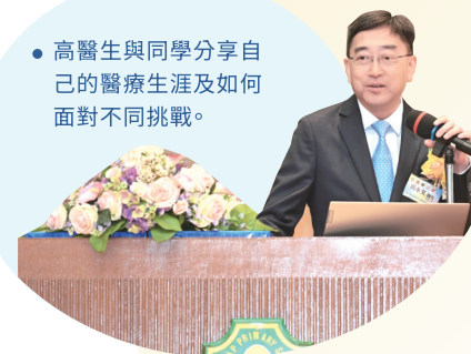
● 高醫生與同學分享自己的醫療生涯及如何面對不同挑戰。