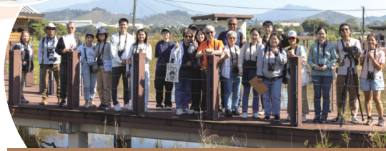
• 靜觀飛羽 (塋原生態水彩體驗)