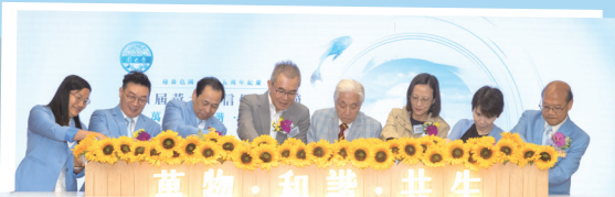
● 啟動儀式上，眾嘉賓將彩沙倒入開幕裝置，向日葵隨之綻放，象徵萬物共生。