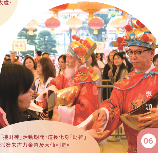
● 「接財神」活動期間，道長化身「財神」派發朱古力金幣及大仙利是。