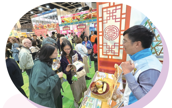
● 本園職員介紹齋色園研發的特色軟餐。