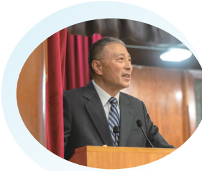
● 中國航天集團江帆研究員

為慶祝嘉色園創辦105周年及可觀自然教育中心成立30周年，本園與香港新一代文化協會合辦「中國航空及航天科技」專題講座系列。2025年11月中旬，本園特邀三位中國航空及航天領域的資深專家訪港，展開為期一周的科普交流。專家團隊包括：北京航空航天大學航空發動機研究院陳志英教授、航空科學與工程學院張華教授，以及國家衛星工程總設計師江帆研究員。三位專家在流體力學、衛星工程及航空教育領域具深厚資歷，為本港師生帶來最前沿的科研視野。