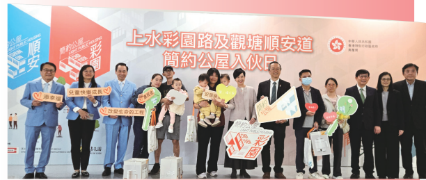
● 觀塘順安道及上水彩園路的校舍改建而成的簡約公屋於2025年11月24日舉行派鎖匙儀式。

為填補公營房屋供應不足的缺口，政府於《2022年施政報告》中提出興建「簡約公屋」，為居住環境欠佳的基層市民提供可負擔的房屋，盡快改善他們的生活質素。簡約公屋主要透過兩種模式推行：一是在閒置政府用地以「組裝合成」建築法快速興建；二是將空置校舍活化成為住宅單位。