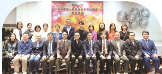
● 可風中學暨可譽小學校董、老師及家教會成員合影。

秉持「家校同心，育才同行」的精神，齊色園各教育單位將持續加強家校協作，攜手為學生營造更美好、更有愛的學習與成長環境。