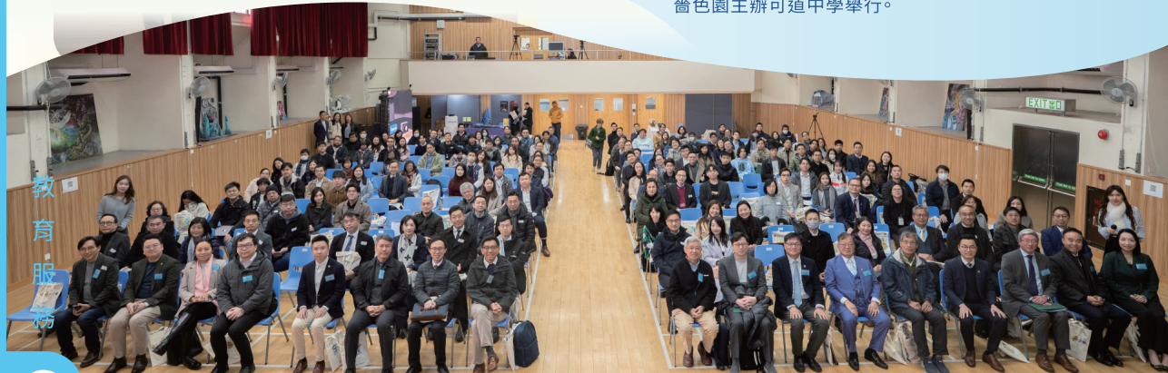
●「未來教育論壇：擁抱AI，賦能教學，開創教育新格局」在嘉色園主辦可道中學舉行。

是次論壇不僅展示AI技術在教育中的應用，更啟發教育工作者對教學本質的反思。可道中學期望透過這次活動，為香港教育界提供寶貴的交流平台。嘉色園將繼續與各方攜手，推動教育在AI時代穩步發展，為學生創造更具啟發性和溫度的學習歷程。