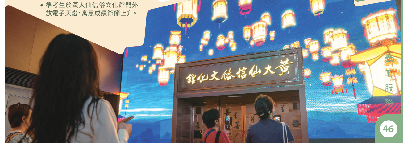
• 準考生於黃大仙信俗文化館門外放電子天燈，寓意成績節節上升。