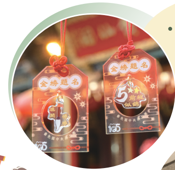
• 公開試考生（包括DSE、內地高考、IB國際文憑考試）於「金榜題名卷軸」上留名及祈願，均獲贈福牌乙個。