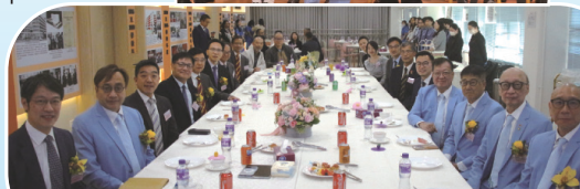
● 齊色園教育委員會各委員祝酒。