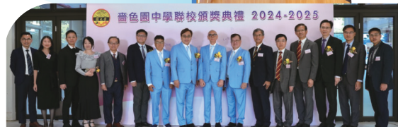
● 2024-25年度齊色園中學聯校頒獎典禮於可立中學隆重舉行。

典禮圓滿舉行，需感謝各位董事、校監、校董、家長，以及五校教職員的辛勤付出與全力支持。適逢齊色園迎來105周年紀念，本園將繼續承傳「普濟勸善」使命，為香港培育更多胸懷大志、德才兼備的青年一代。