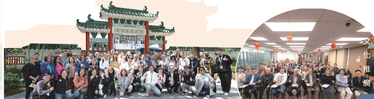
• 課堂吸引近80位本園會員及導賞員參與，一同追溯仙祠創建前的發展軌跡。