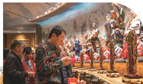
● 善信到太歲元辰殿拜太歲，祈求新一年平安順遂。