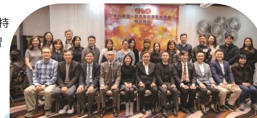
● 可譽中學校董、老師及家教會成員合影。