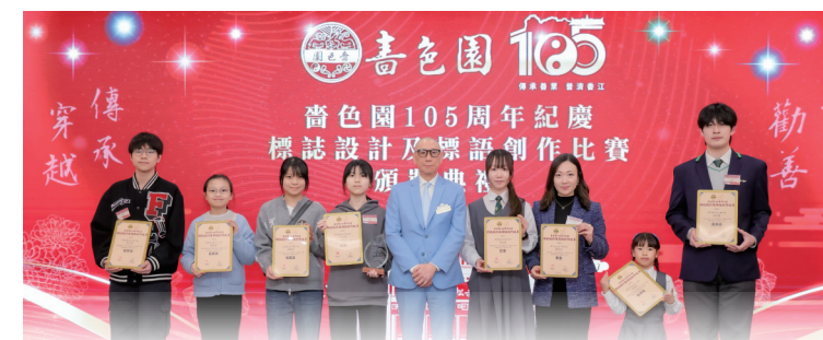
• 紀念標誌與標語比賽得獎者在晚宴上獲善色園董事會成員頒獎。

為慶賀善色園105周年紀念此重要日子, 本園特成立籌備委員會策劃一系列紀念活動, 並率先推出標誌設計及標語創作比賽, 邀請善色園全人參與。所獲反應極為熱烈, 在兩個月的徵集期內, 吸引超過900人參加, 收集多達1200份作品。得獎名單於乙巳年酬答天恩大典暨善色園105周年紀念開幕晚宴當晚正式公布並頒獎。