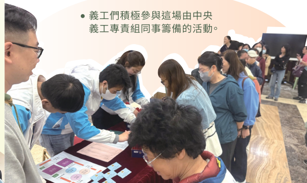
義工們對競技小遊戲讚不絕口。