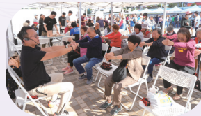
● 開心活力工作坊由導師教健體運動。