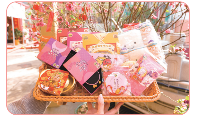
● 配合今年月老殿啟用，首批推出的文創產品以「月老文化」為主。

齋色園首個文創品牌——「大仙文創」於2026年2月13日在黃大仙祠月老廣場正式開幕，標誌著本園在信俗文化傳承上邁向新里程。開幕當日，多款設計新穎、蘊含深厚文化意涵的文創精品首度亮相，吸引大批善信駐足。「大仙文創」首批精品配合今年年初重光的月老殿，以月老文化為主，將善緣、祝福傳遞予善信；此外亦因應祠廟特色而作出相應設計。