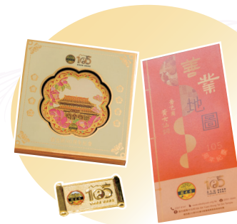
• 出席嘉賓均獲贈《善業地圖》小冊子、普善明鏡、善業襟章等禮物, 以呼應黃大仙師「普濟勸善」的寶訓。