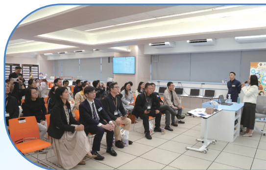
● 可銘學校向到訪的福建省中小學教師簡介如何使用AI英語學習平台協助學生自主學習。

2025年12月10日下午，香港公共行政學院福建省研修班一行23人蒞臨嗇色園主辦可銘學校。參訪團參觀了嗇色園生物科技流動實驗室及大灣區AI科教基地，並聽取學校在辦學理念、治理創新與人工智能教育方面的實踐經驗分享。雙方隨後就科技融合課程設計、學生管理及校本創新等議題進行深入交流，氣氛熱烈。