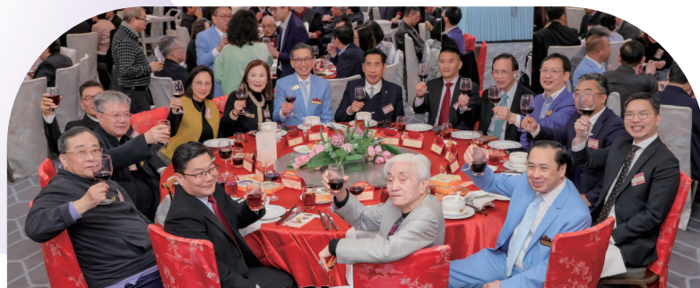
• 「乙巳年酬答天恩大典暨善色園105周年紀念開幕晚宴」於2026年2月2日(農曆十二月十五日)晚圓滿舉行,善色園董事會成員、職員與義工聯同各界好友,共逾六百人齊聚一堂。