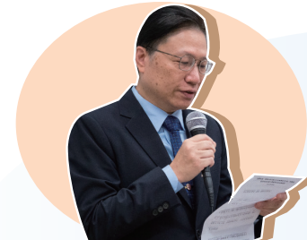
• 香港中文大學協理副校長高永雄教授