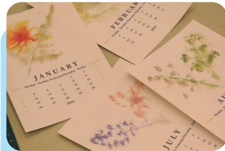
• 2025年12月13日，植物拓染月曆卡工作坊。