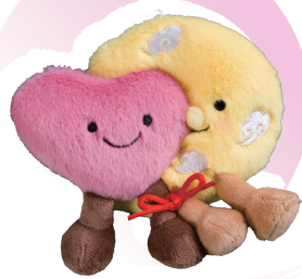
● 桃花樹下的月老心心公仔