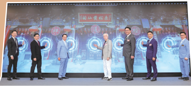
• 開幕儀式影片讓一眾主禮與台下來賓在光影之中回顧善色園105年的善業歷程。