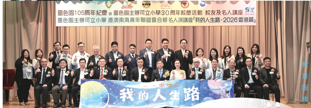
● 嗇色園主辦可立小學法團校董會成員與演講嘉賓及合辦機構代表合影留念。