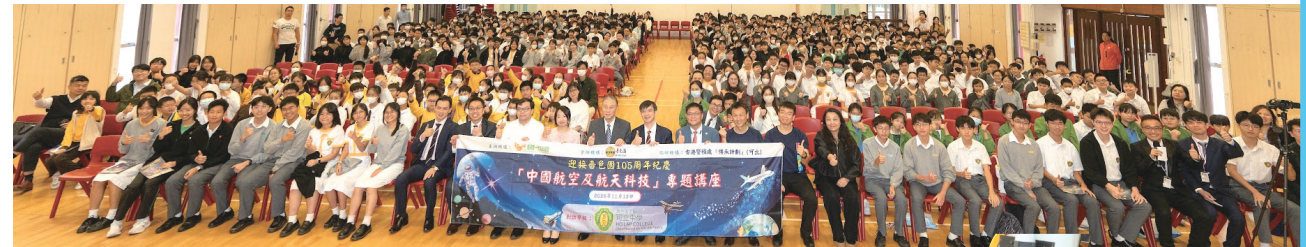
●為慶祝嘉色園創辦105周年及可觀自然教育中心成立30周年，本園與香港新一代文化協會合辦「中國航空及航天科技」專題講座系列。