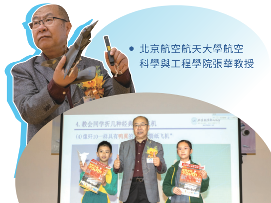
● 北京航空航天大學航空科學與工程學院張華教授

系列活動的重點項目，是11月15日假香港會議展覽中心舉行的「啟動禮暨專題講座」。上午場次吸引全港多名中小學校長及教師參與，深入探討航空科技與科研精神；下午的學生專場則聚焦飛行器設計與渦輪技術，內容充實，現場掌聲經久不息。是次活動吸引屬校數千名師生踴躍參與，促進兩地科普教育交流，亦讓創科精神扎根社區。本園期望透過與頂尖專家的互動，為香港未來的科研及工程發展儲備人才。