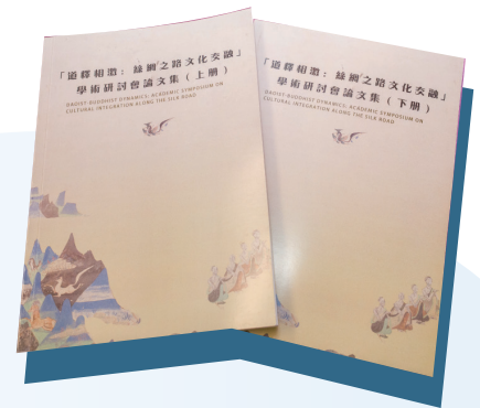
• 「道釋相激：絲綢之路沿線文化交融」學術研討會論文集，收錄一眾學者的研究成果。

齋色園自2024年開始，資助香港中文大學(中大) 150萬港元進行為期2年的「絲路沿線石窟寺道教遺跡與地方社會研究」。作為研究計劃其中一個里程碑，中大佛學研究中心及宗教倫理及中國文化研究中心於2026年4月21日起一連三日，於中大康本國際學術園舉行「道釋相激：絲綢之路沿線文化交融」學術研討會，邀請40多位國內敦煌學、宗教學、文物學、圖像學、藝術學等學科專家學者，展開跨學科對話，圍繞絲綢之路沿線的文化遺產展開全方位探討，在「鑒古」之餘，亦對國家「一帶一路」發展戰略具有「識今」意義。