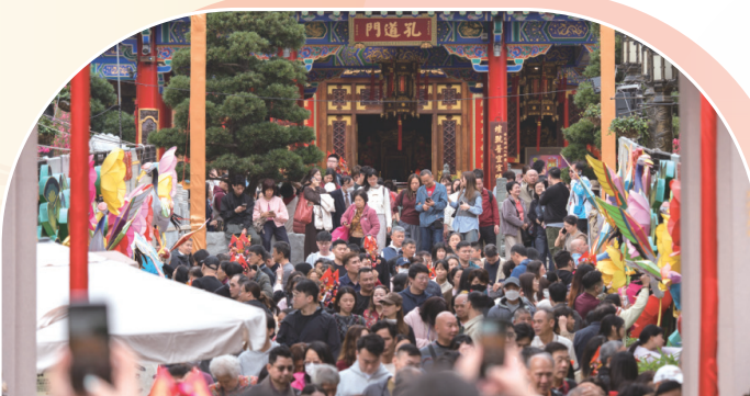
● 新春期間黃大仙祠香火鼎盛、人山人海。

每年農曆新年，都是黃大仙祠香火最為鼎盛的時候，大仙祠內人潮熙攘，大批善信趁著新正頭入園參神祈福，祈求新一年事事順利。丙午年新春期間(年廿九晚至正月十五)，黃大仙祠共錄得接近65萬的入園人次，場面熱鬧。