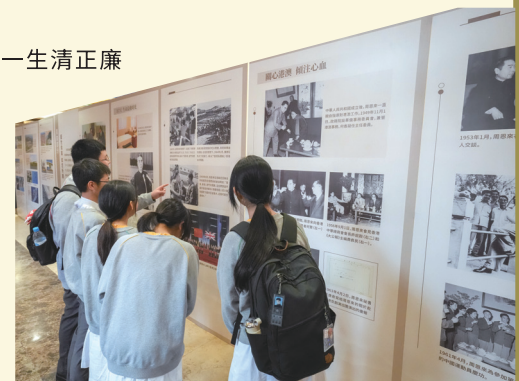
● 學生透過觀展以了解周恩來總理生平及貢獻，有助加深了解國情。

超藝理想文化學會會長陳復生女士在致辭時指出，展覽在本港不同地方展出，但部分地點為預約制，市民或因此向隅，「非常感謝嗇色園慷慨借出場地，黃大仙祠終年對外開放，遊客絡繹不絕，可以讓更多人觀看到展覽。」