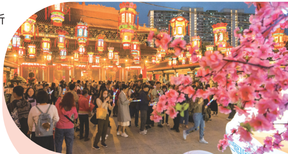
● 元宵佳節當晚，第一參神平台人頭湧湧。

元宵晚會當晚，不少善信在參拜月老後捐款請領「月老手繩」及祈願卡，於祈願卡寫下心願後掛在園內玉液池及從心苑的「祈願桃花樹」上，是夜滿園桃花樹上亦掛滿善信祈願，祈求月老協助廣結善緣；亦有不少善信請領本園文創店「大仙文創」所推出的一系列精美助緣文創品，包括月老小福袋、心月之約手繩、情侶皮手繩、姻緣美滿冰箱貼、月老姻緣簿造型公仔、月亮心心公仔，寓祝福於日用。