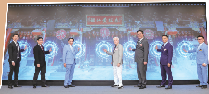
• 開幕儀式影片讓一眾主禮與台下來賓在光影之中回顧善色園105年的善業歷程。