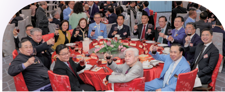
• 「乙巳年酬答天恩大典暨善色園105周年紀念開幕晚宴」於2026年2月2日(農曆十二月十五日)晚圓滿舉行,善色園董事會成員、職員與義工聯同各界好友,共逾六百人齊聚一堂。