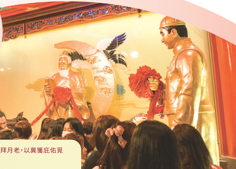
• 眾多熱情的善信於元宵佳節前往月老殿參拜月老，以冀獲庇佑得良緣佳偶，已婚者則幸福美滿。