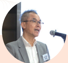
● 非物質文化遺產諮詢委員會主席 麥勁生教授

「迎齋色園105周年紀慶：第四屆黃大仙信俗文化節」已於2025年11月15日至11月23日圓滿舉行。本屆文化節以「萬物·和諧·共生」為主題，透過逾20項活動，回應社會對生態保育與可持續發展的關注，展現傳統文化與當代議題的深度連結。