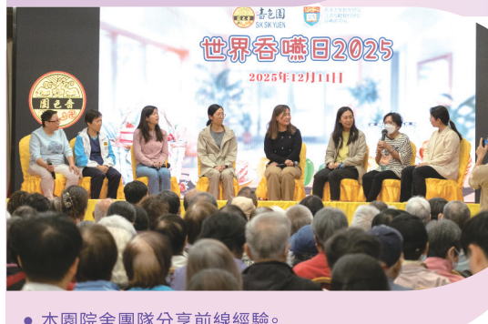
● 本園院舍團隊分享前線經驗。