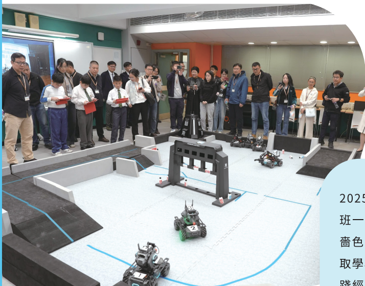
● 可銘學校師生向到訪的福建省中小學教師示範STEAM教學。