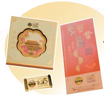
• 出席嘉賓均獲贈《善業地圖》小冊子、普善明鏡、善業襟章等禮物, 以呼應黃大仙師「普濟勸善」的寶訓。