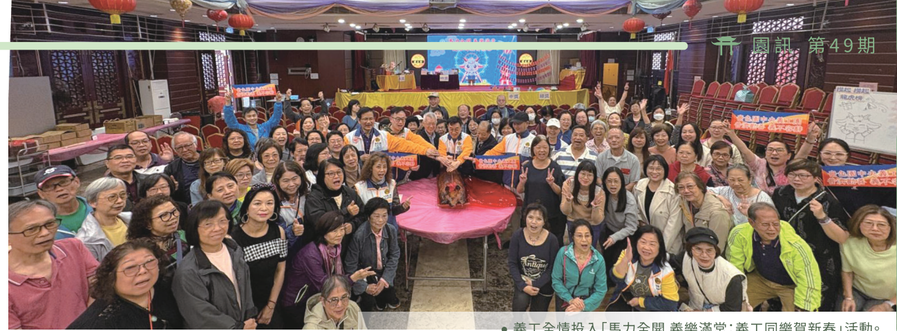
義工全情投入「馬力全開 義樂滿堂：義工同樂賀新春」活動。