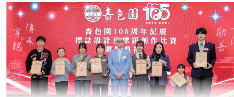
• 紀念標誌與標語比賽得獎者在晚宴上獲善色園董事會成員頒獎。

為慶賀善色園105周年紀念此重要日子, 本園特成立籌備委員會策劃一系列紀念活動, 並率先推出標誌設計及標語創作比賽, 邀請善色園全人參與。所獲反應極為熱烈, 在兩個月的徵集期內, 吸引超過900人參加, 收集多達1200份作品。得獎名單於乙巳年酬答天恩大典暨善色園105周年紀念開幕晚宴當晚正式公布並頒獎。