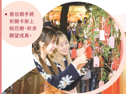
• 善信親手將祈願卡掛上桃花樹，祈求願望成真。