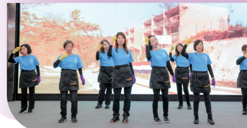
• 善色園中央義工團的手語歌合唱團, 以手口並演的方式, 演繹善色園的百載故事。