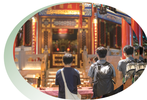
• 考生前往麟閣參拜孔聖先師，祈求考試勇奪佳績。