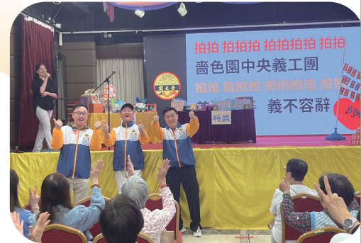
開場前不忘練習耆色園中央義工團的口號與節拍。