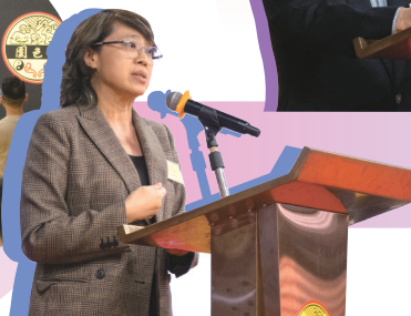
● 香港大學吞嚥研究所所長陳文琪教授