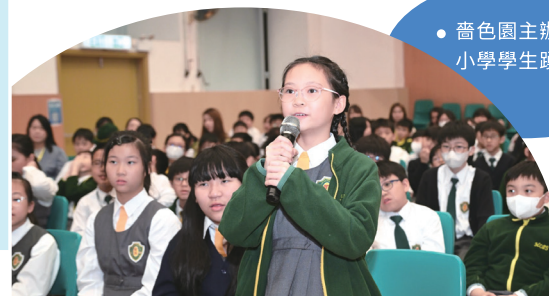
● 嗇色園主辦可立小學學生踴躍發問。

現場氣氛熱烈，同學踴躍提問，展現好學善思的精神面貌。可立小學期望透過此類活動，讓學生從榜樣身上汲取力量，樹立人生目標，傳承嗇色園「適性揚才·啟迪未來」的教育理念。港澳南海青年聯誼會代表表示，將持續與學校合作，助力青少年全面發展。