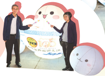
● 遊園人士於園內設置的「月亮」及「巨型湯圓」前拍照留念。

元宵節（農曆正月十五）素有「中國情人節」之稱，因歷史上傳統婦女門禁深嚴，平日鮮有步出閨門，在元宵節則可外出遊玩，故不少男女亦藉此相識、結下良緣。齋色園素以弘揚中國傳統文化為己任，特於元宵節（農曆正月十五、西曆三月三日）續辦元宵晚會，開放時間亦延長至晚上九時，與善信同樂。