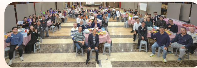
• 團年派對：百人大合照