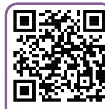
歡迎掃描QR Code收看影片, 了解本園百多年來的善業足跡。