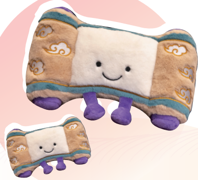
● 月老姻緣簿公仔(大、小)