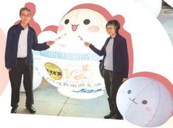
• 遊園人士於園內設置的「月亮」及「巨型湯圓」前拍照留念。

元宵節（農曆正月十五）素有「中國情人節」之稱，因歷史上傳統婦女門禁深嚴，平日鮮有步出閨門，在元宵節則可外出遊玩，故不少男女亦藉此相識、結下良緣。齋色園素以弘揚中國傳統文化為己任，特於元宵節（農曆正月十五、西曆三月三日）續辦元宵晚會，開放時間亦延長至晚上九時，與善信同樂。