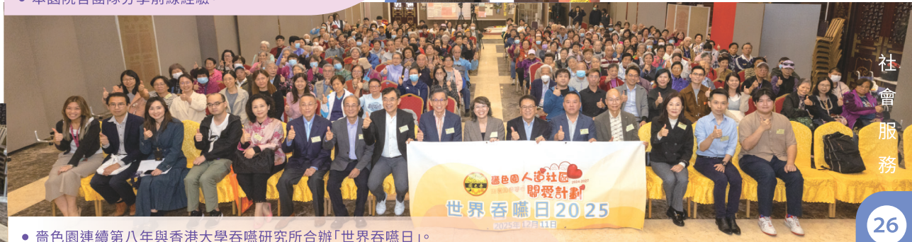
● 嗇色園連續第八年與香港大學吞嚥研究所合辦「世界吞嚥日」。