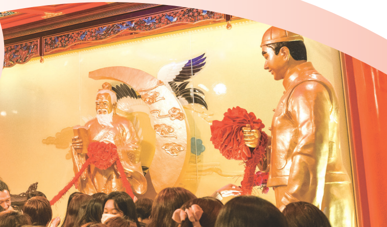
● 眾多熱情的善信於元宵佳節前往月老殿參拜月老，以冀獲庇佑覓得良緣佳偶，已婚者則幸福美滿。