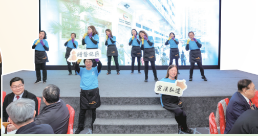
手語歌合唱團帶領賓客做出「祝願耆色園105周年快樂」的手語動作。