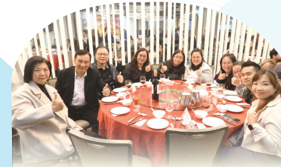
● 本園轄屬幼稚園校監、校長與家教會共享晚宴。