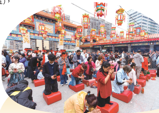
● 不少善信在「新正頭」求籤，希望得到黃大仙師指引。