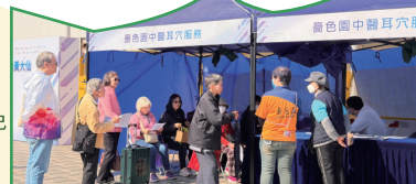
● 本園於活動當日，為入場人士提供免費中醫耳穴服務。