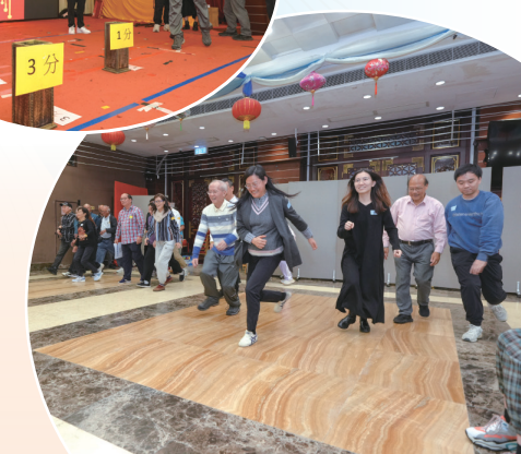
• 體適能挑戰賽：齋色園董事、導賞員及職員全情投入，笑聲不斷。