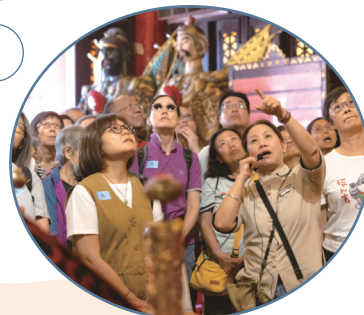
• 黃大仙祠文化導賞