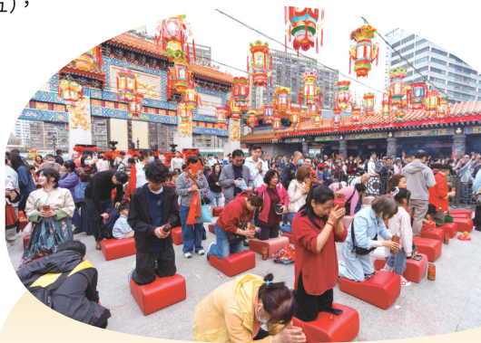
● 不少善信在「新正頭」求籤，希望得到黃大仙師指引。