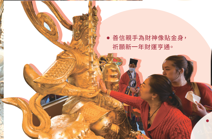
● 善信親手為財神像貼金身，祈願新一年財運亨通。