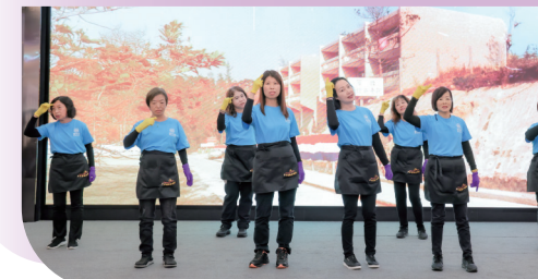
• 善色園中央義工團的手語歌合唱團, 以手口並演的方式, 演繹善色園的百載故事。