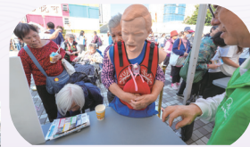
● 嘉年華設「家居急救學堂」攤位，由導師示範及讓參加者嘗試急救。