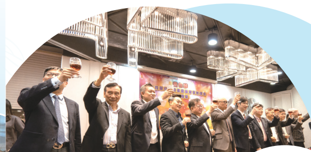
● 齊色園教育委員會各委員祝酒。