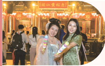
• 善信身穿華服，手持本園贈送之入園發光小禮物（發光串燒湯圓）夜遊黃大仙祠。