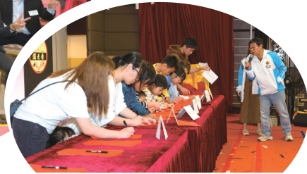
● 嗇色園社會房屋(過渡性房屋可悅居、順安道及彩園路簡約公屋項目)新春盆菜宴