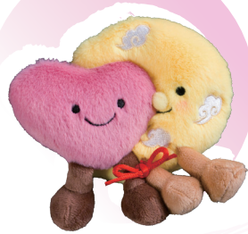
● 桃花樹下的月老心心公仔