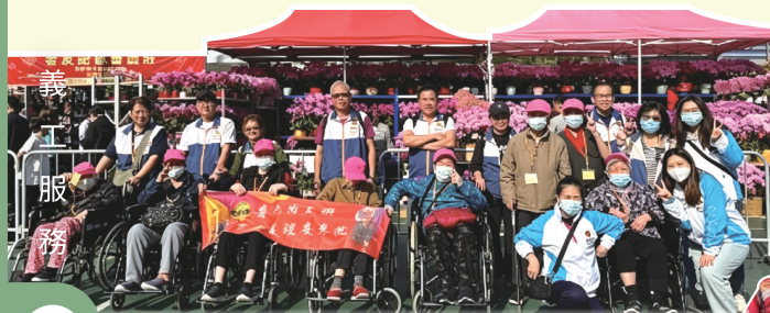
義工陪同院友一同前往花市及商場採購新年用品與衣物。