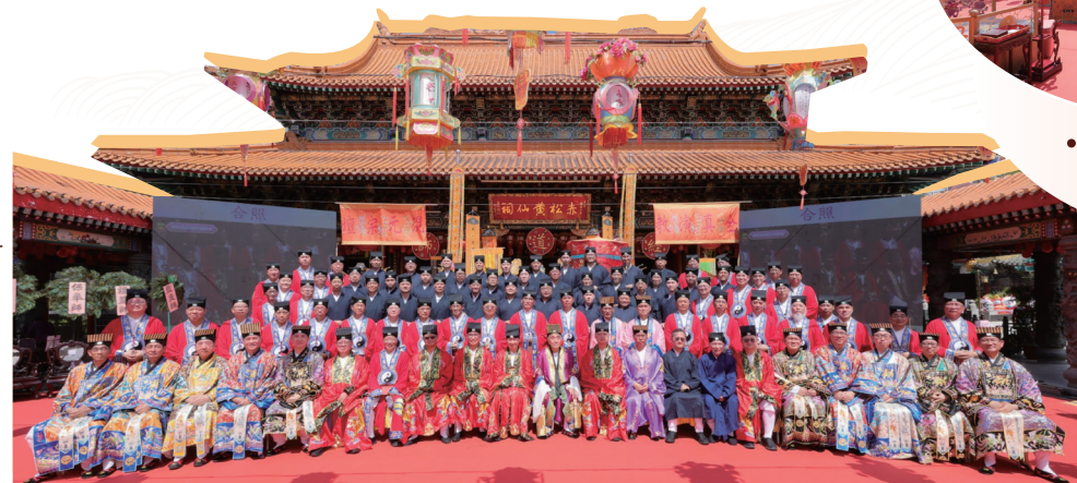
● 「第十屆道教全真道皈依冠巾證盟科儀」於2025年10月4日（農曆八月十三日）圓滿舉行。