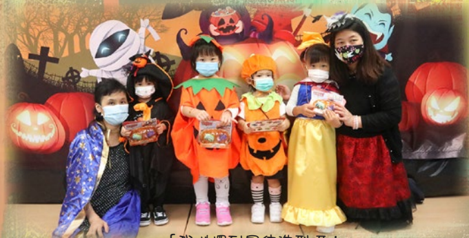
「我哋攞到最佳造型呀！」