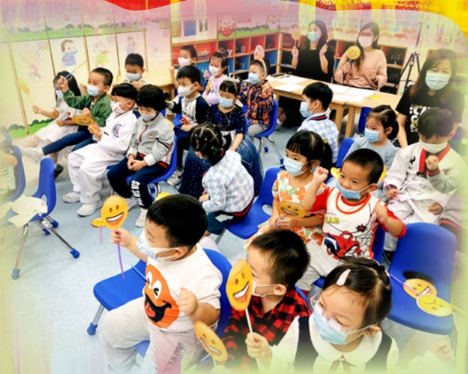
你看！幼兒和評審正在欣賞「才藝表演」，多投入喇！