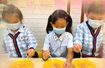
「我哋學整糖不用呀！ 好美味呀！」