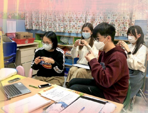
小朋友很棒啊！能唸讀整首兒歌，老師送你一個心吧！