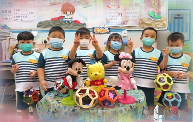
「祝大家中秋節快樂！」