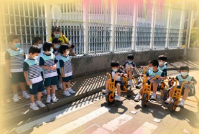
過馬路，看清楚， 車子停定才好過。