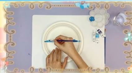
「先在中間畫一條直線。」