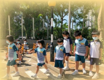
「我哋嘅斑馬線上過馬 路都要大步走呀！」