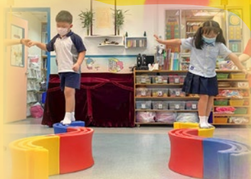
「我哋雲挑戰走過 S 形平衡木呀！」