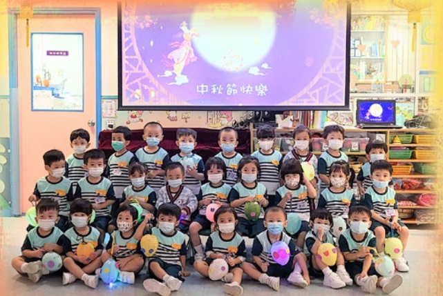
「中秋節，我哋一齊提燈賞月。」