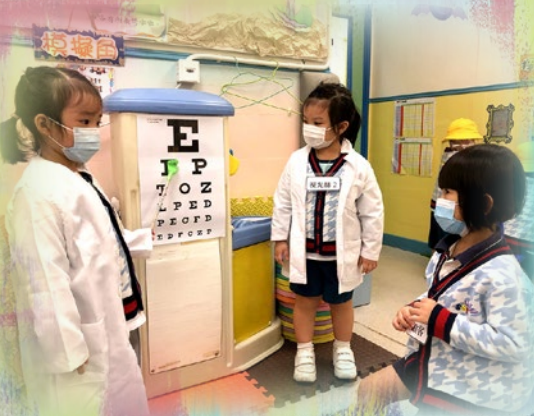
「請坐低，等我幫你驗眼啦！」