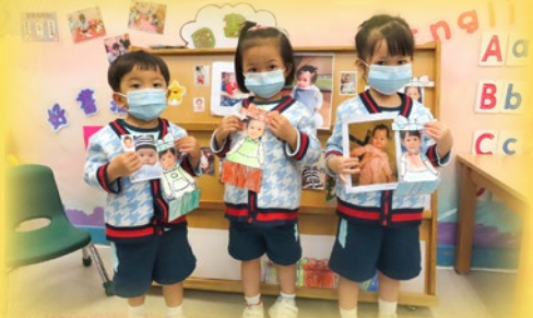
「我BB嘅時候咁味好可愛？」