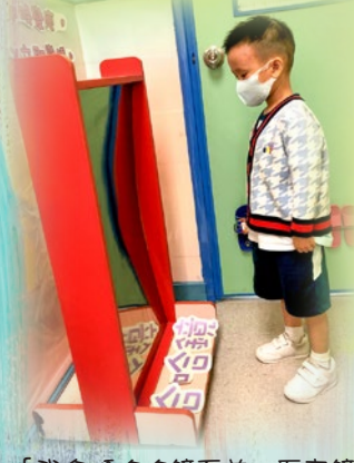
「我企喺哈哈鏡面前，原來鏡上嘅我會變形，好得意呀！」