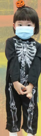
「我扮成骷髏骨 頭嘅，你哋驚唔 驚呀？」