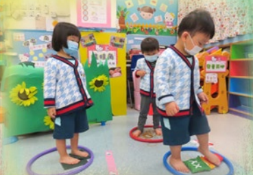
踩一踩，這個豆袋是軟綿綿的喇！