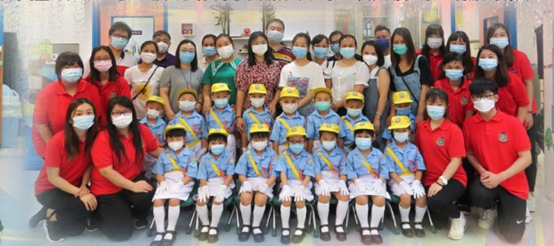
「我哋就嚟交通安全隊嘅新成員啦！」