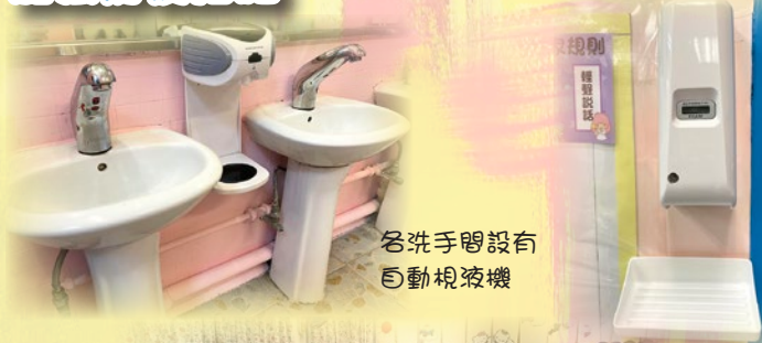
各洗手間設有 自動噴液機