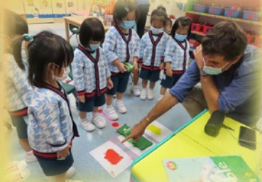
外籍英語老師和我們一起玩遊戲！