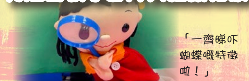
「一齊睇吓 蝴蝶嘅特徵 啦！」