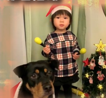
「搖搖沙槌，我和小狗 一齊唱聖誕歌！」