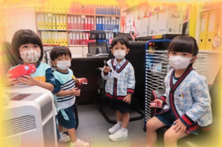
「我哋係校長室搵到玩具車啦！」