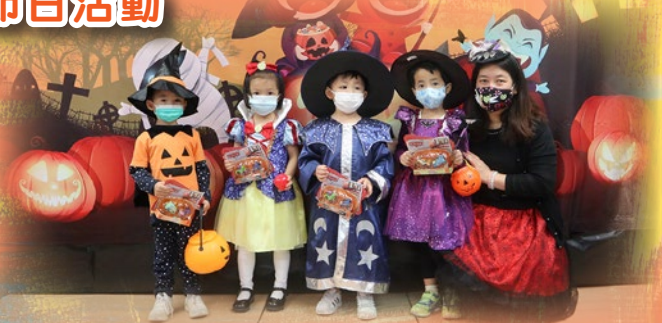
「睇吓我哋嘅萬聖節獎品！」