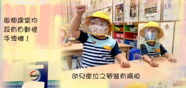
每個課室均 設有自動搓 手液機！