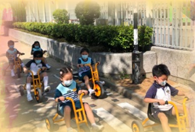
「我哋第一次做司機， 真係覺得好興奮呀！」