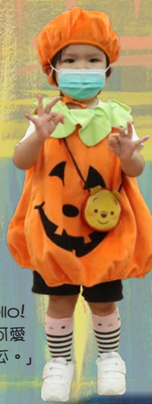
「Hello! 我係可愛 小南瓜。」