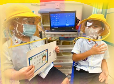
「等我試下用普通話介紹自己先！」