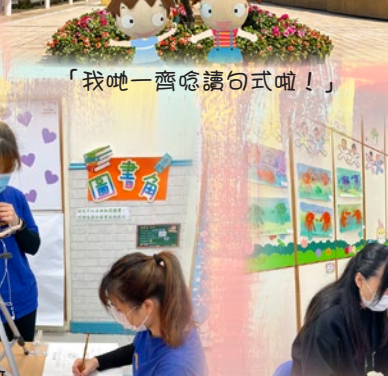
老師正在拍攝 功課教學影片