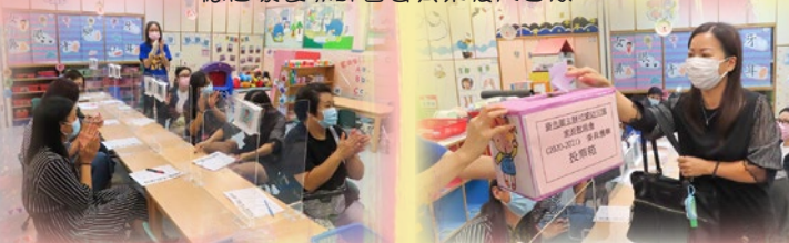
「否員互選結果產生了！」