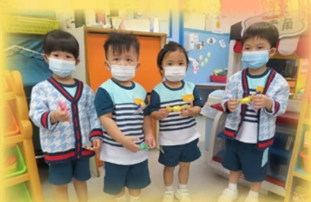
「我哋係課室玩尋寶遊戲～我搵到糖啦！」