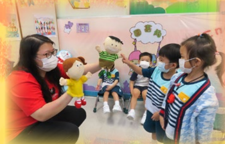
"I am a boy."