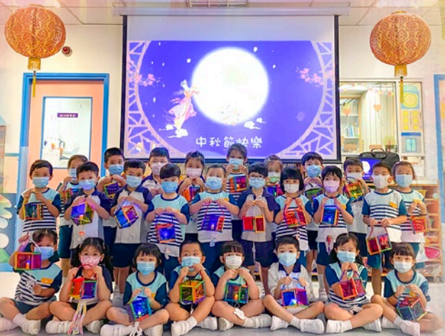
「祝大家中秋節快樂！」