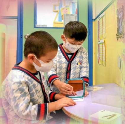
「我哋用塊鏡睇下呢個圖案原唔原對稱嘅？」