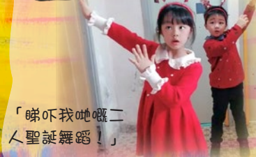
「睇吓我哋嘅二 人聖誕舞蹈！」