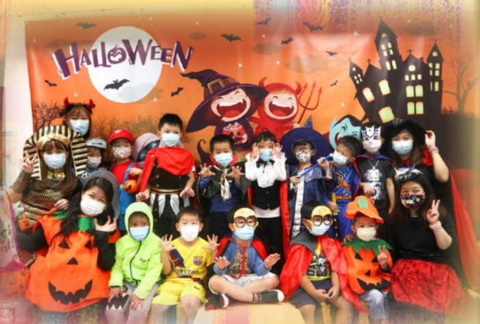
嘩！我們的造型趣怪鬼馬嗎？Happy Halloween~~~