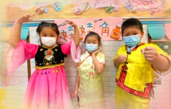
「我哋著得咁靚，等我哋擺 返個 pose 影張相先！」