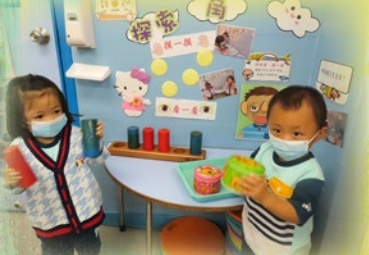
「等我哋搖下個鐘，聽下會 發出咩聲音先！」