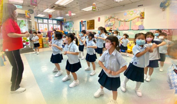
「我哋一齊跟住老師做早操呀！」