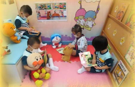
幼兒很專心在圖書角閱讀圖書。