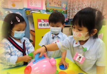
「齊齊玩玩具，好開心呀！」