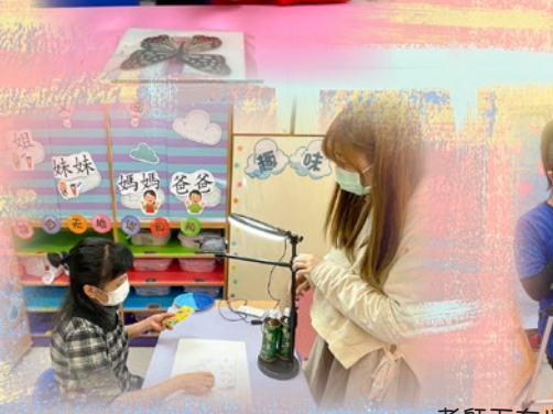
老師正在拍攝圖文教學影片