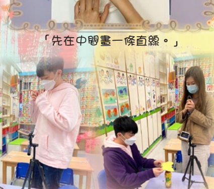
老師正拍攝探索活動的影片