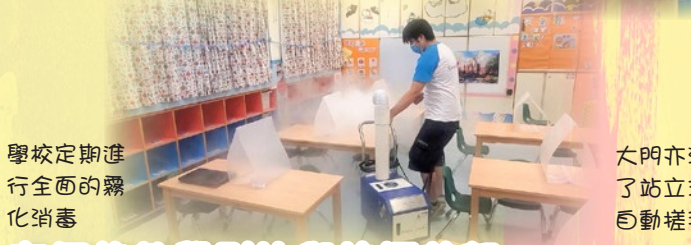
學校定期進 行全面的霧 化消毒