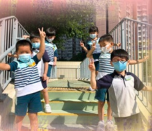
「我哋係行人天橋上面啦！」