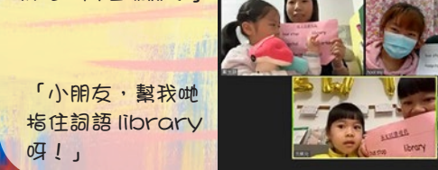
「小朋友，幫我哋 指住詞語 library 呀！」