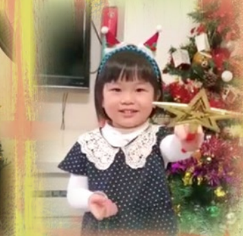
「老師，祝你聖誕快樂！」