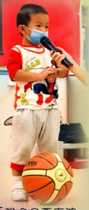
「我今日會表演嘅原打籃球。」