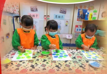
「睇吓，我哋嘅海綿印畫幾靚！」