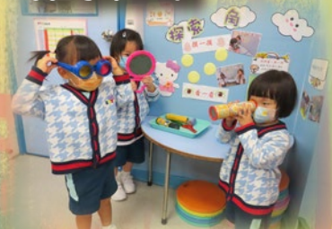
「嘩！我睇到好多顏色呀！」