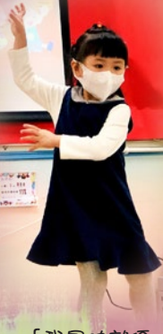
「我最叻就原跳舞啦！」