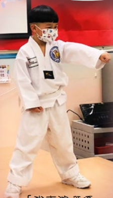
「我表演嘅原路拳道，哈！」