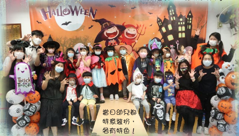
當日幼兒都特意裝扮，各有特色！