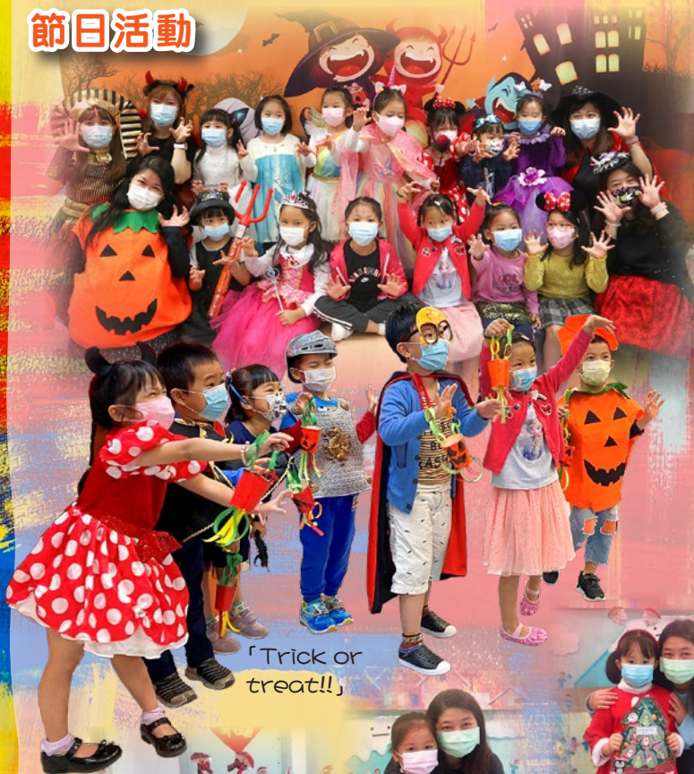
「Trick or treat!!」