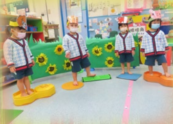
小腳板踏在凹凸凸凸的路上， 感覺很有趣喇！