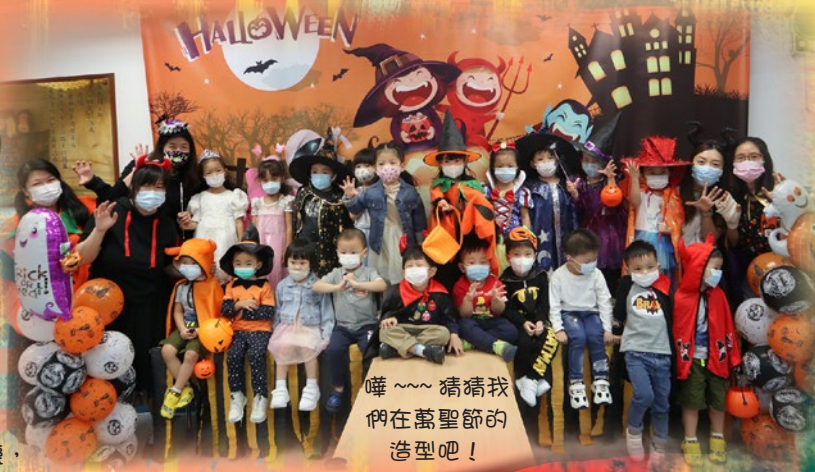
嘩～～猜猜我哋在萬聖節的造型吧！