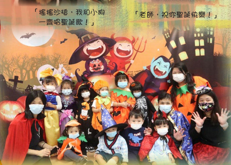
Happy Halloween! 幼兒古靈精怪的造型，很有趣吧！