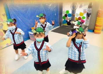
「小烏龜慢慢爬...爬...爬...」