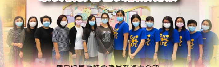
應屆家長教師會委員來張大合照