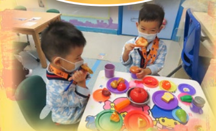
「雞髀真係好好味呀！等我食咗佢先。」