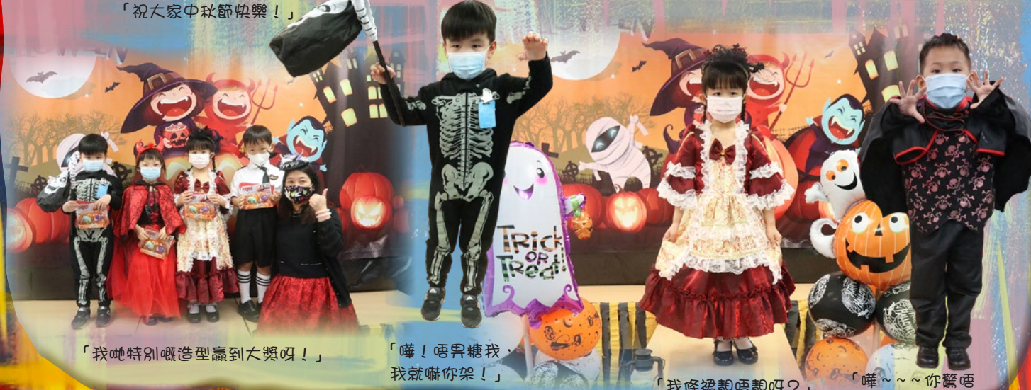
「我哋特別嘅造型贏到大獎呀！」