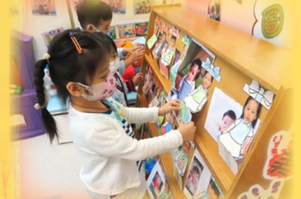
「佢個就係BB時候嘅我啦！」