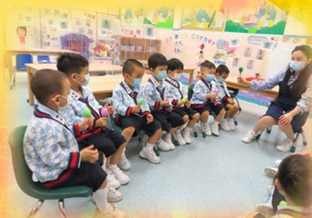
幼兒在普通話活動時介紹自己的名字。