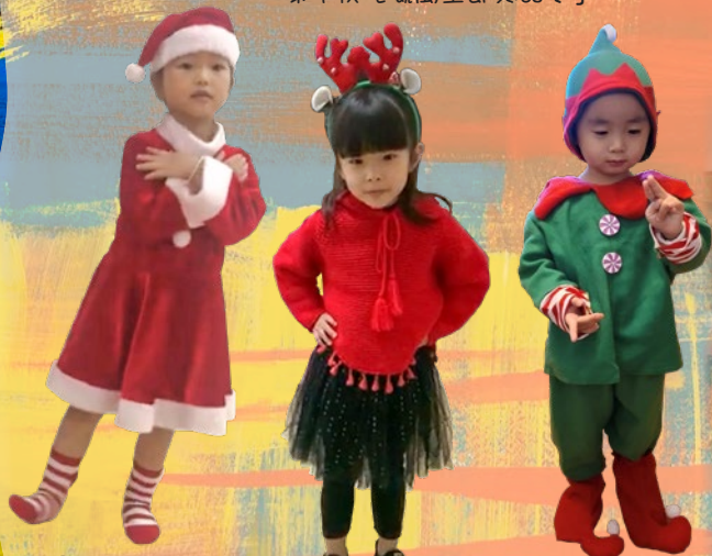
「你哋鍾意我嘅聖誕舞蹈嗎？」