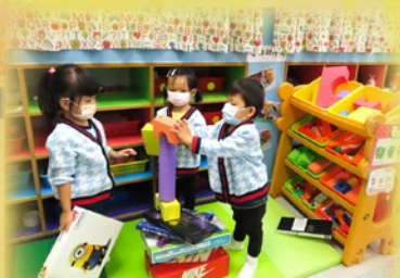
「我哋一齊砌咗個城堡，靚嗎？」