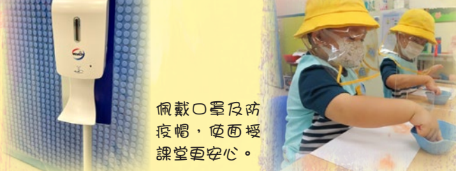
佩戴口罩及防 疫帽，使面授 課堂更安心。