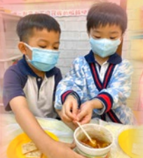
「你幫我扶住碗麥荳 糖呀！唔該。」