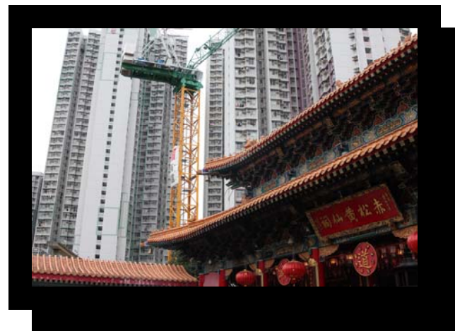
「時代的變遷」