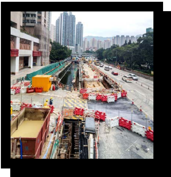
「新氣象 新希望」