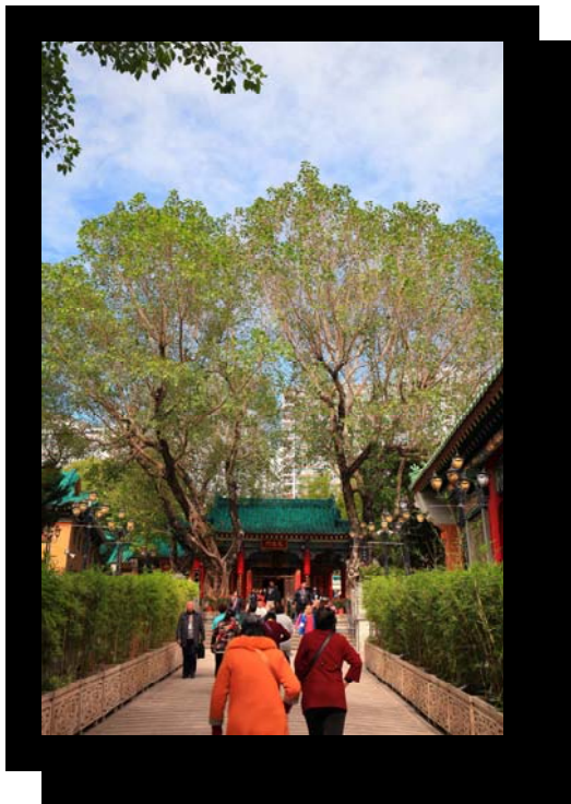
「滿園翠色迎善信」