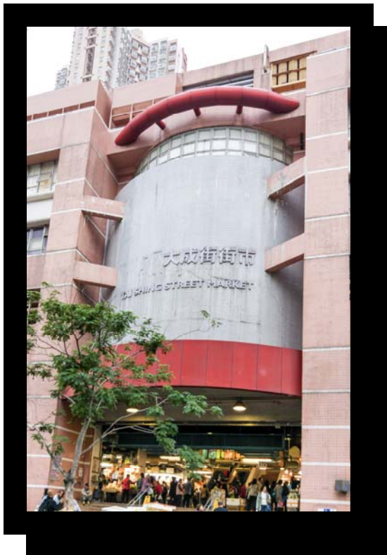
「美麗的鬧市」