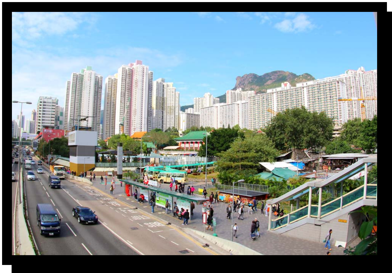
「獅子山下·新舊雙存」

站在龍翔道的天橋上拍攝這張照片，感受到今日的黃大仙已經是一個發展成熟的社區；車輛、途人不絕。拍攝當天，天色蔚藍，配合社區內的景象，構成一張美麗而富動感的照片。