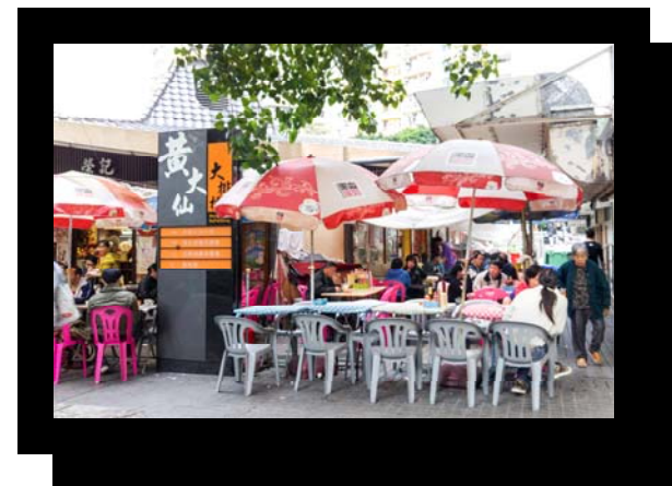
「大眾口味」