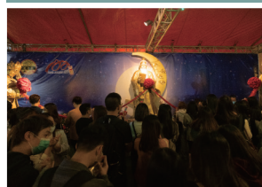
男女善信參拜月老，祈求良緣。